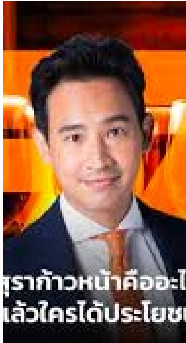
Former Head MFP