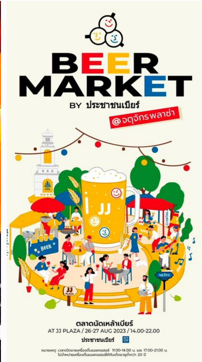
Beer Citizens' activity