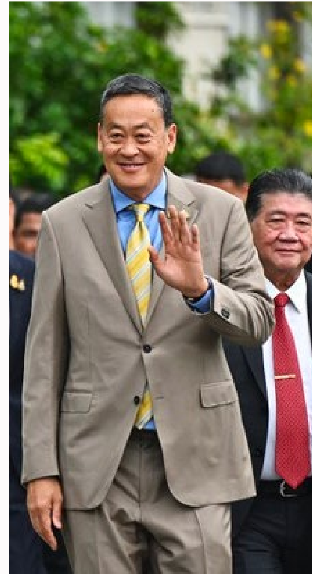
Current Prime Minister